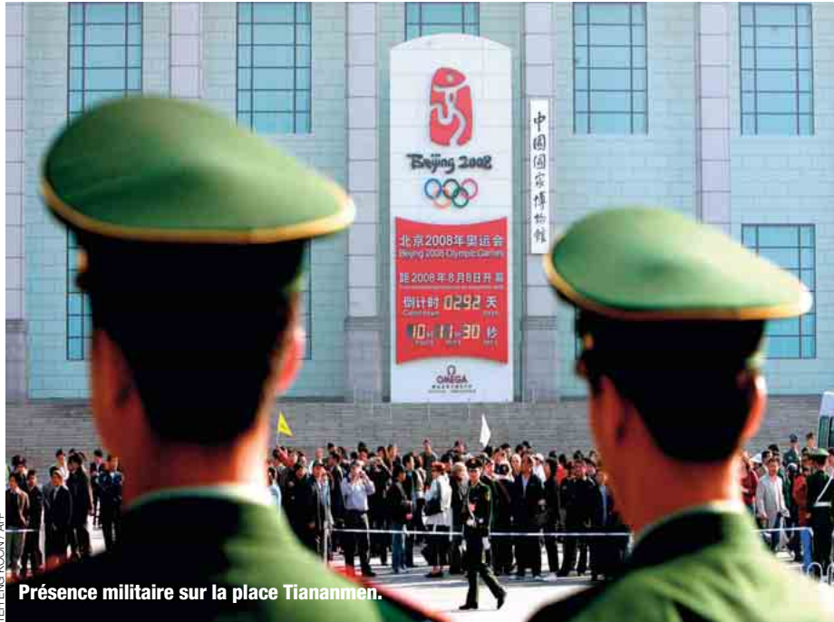
Présence militaire sur la place Tiananmen.

La Chine, qui compte 1,3 milliard d'habitants et aime faire les choses en grand, a tout prévu, selon Roger Faligot, qui vient de publier Les services secrets chinois – de Mao aux JO (éd. Nouveau Monde). Rien que pour l'événement, 150 000 à 200 000 personnes seraient déjà sur les dents au sein d'un centre de commandement, doté de 1,3 mil-